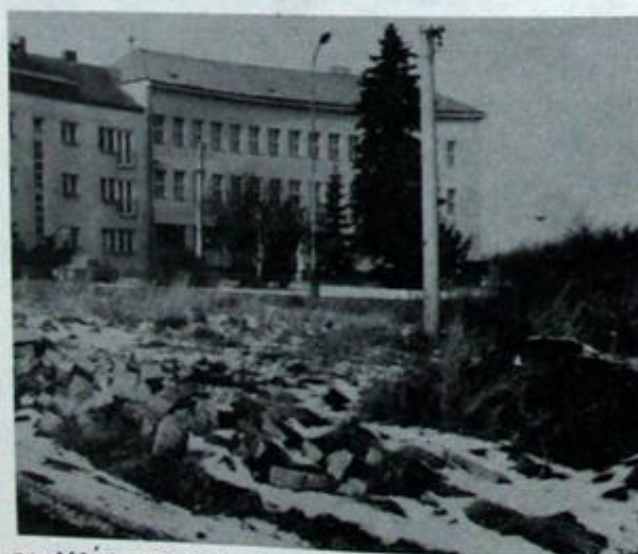
Dva pohledy na pěkné budovy ..... a přece tolik rozdílné. Pomůžete?